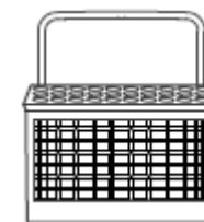
Panier à couverts