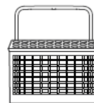
Polica na príbory